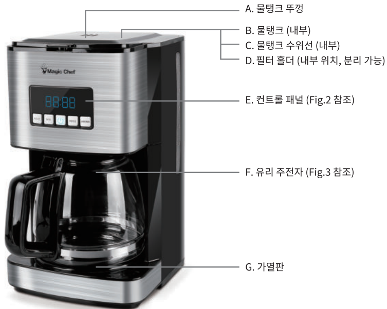
Fig.1 제품 설명도