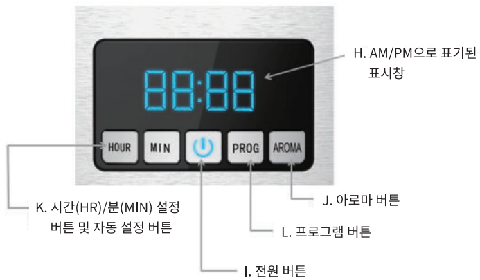
Fig.2 컨트롤 패널 설명도