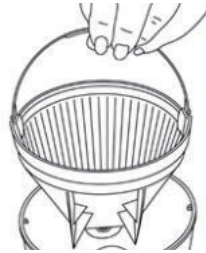
Fig.4 / Fig.5 필터 및 필터 홀더