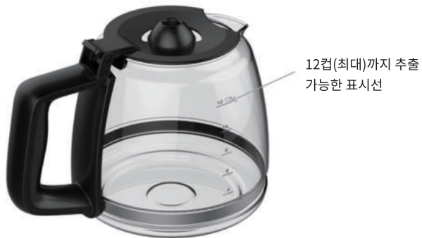
Fig.3 유리 주전자