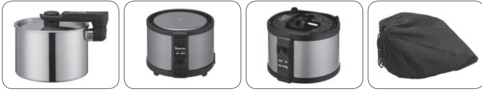
다용도 포트 용기